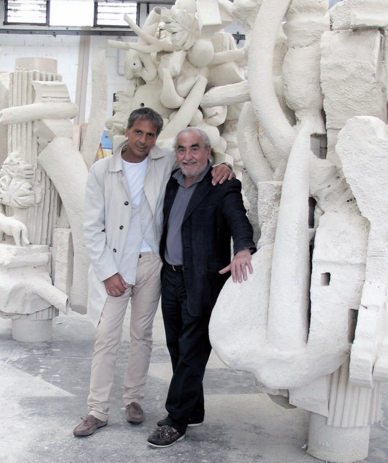
Foto scattate nel capannone di Kubo Effetti speciali a Rodano Millepini, Segrate.

La scultura si compone di quattro blocchi che, montati uno sull'altro, raggiungeranno un'altezza di 9 metri. Ogni blocco contiene numerose forme modellate dall'Artista.