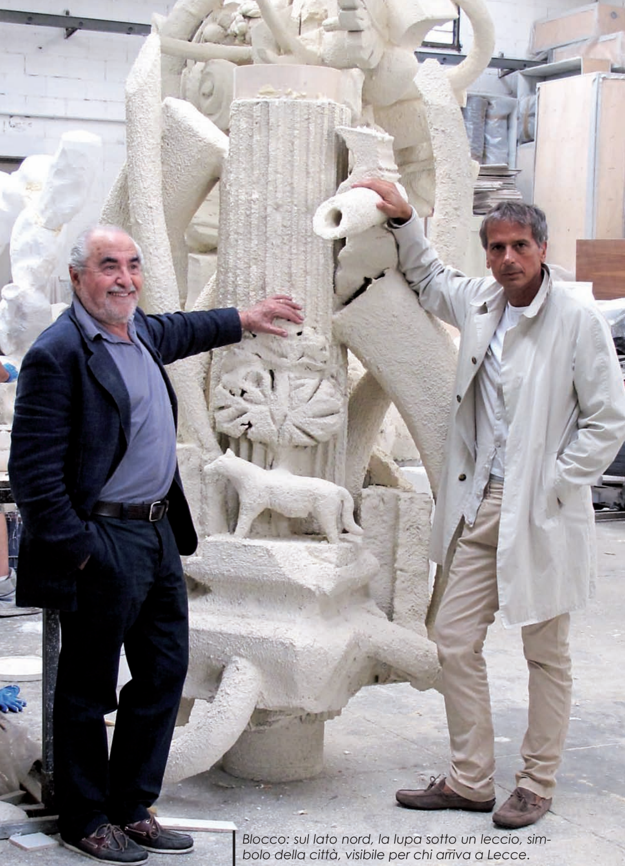
Blocco: sul lato nord, la lupa sotto un leccio, simbolo della città, visibile per chi arriva a Lecce.